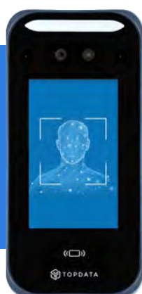
Leitor Facial F4 5 mil usuários

Pode ser usado em ambientes de pouca luz, pois possui câmera infravermelha e iluminação automática