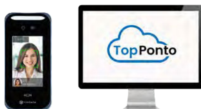
Controle de ponto