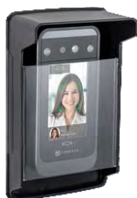
Gabinete para uso externo