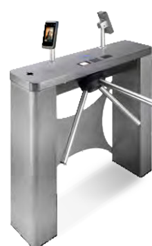
Controle de acesso